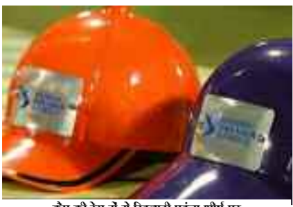
कोप को रेश में से खिलाड़ी पहना शीर्ष पर