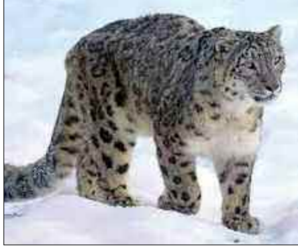
पिथौरागढ़, बागेश्वर, बदरीनाथ, केदारनाथ वन प्रभागों के साथ ही नंददेवी बायोस्फीयर रिजर्व, गंगोत्री नेशनल पार्क, गोविंद वन्यजीव विहार में हिम तेंदुओं की गणना का

देहरादून। उत्तराखण्ड के उच्च हिमालयी क्षेत्रों में हिम तेंदुओं (स्नो लेपर्ड) की वास्तव में कितनी संख्या है, इस राज से पर्दा उठाने के लिए अब इंतजार और बढ़ गया है। हिम तेंदुओं की गणना के मद्देनजर अगले चरण के फील्ड सर्वे और कैमरा ट्रैप लगाने के कार्य में कोरोना संक्रमण ने बाधा खड़ी कर दी है। राज्य के मुख्य वन्यजीव प्रतिपालक के अनुसार परिस्थितियां सामान्य होने के बाद ये कार्य तेजी से किए जाएंगे। उच्च हिमालयी क्षेत्रों में लगे कैमरा ट्रैप में अक्सर हिम तेंदुओं की तस्वीरें कैद होती आई हैं, मगर इनकी वास्तविक संख्या कितनी है यह अभी तक रहस्य बना हुआ है। इसे देखते हुए राज्य में चल रही सिस्कोर हिमालय परियोजना के तहत उच्च हिमालयी क्षेत्र के उत्तरकाशी, रुद्रप्रयाग, टिहरी,