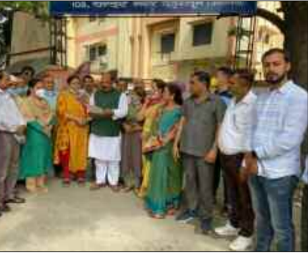
स्कैन मशीन, व्यवस्थित रूप से ट्यूमा सेंटर, अल्ट्रासाउंड, एक्सरे और पथोलॉजी जांच की नई मशीनें की