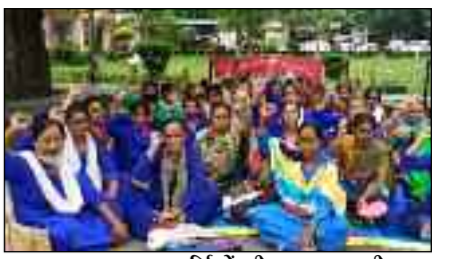
आशा स्वास्थ्य कर्मियों को हड़ताल जारी, सरकार दिखा रही हठधर्मिता