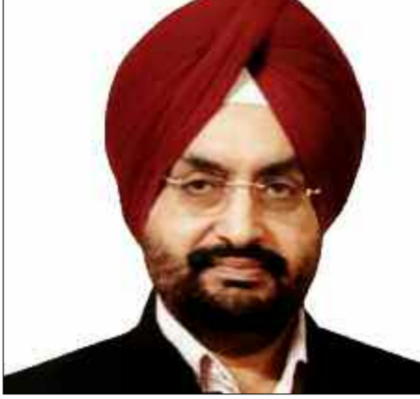
सारी प्रक्रिया समय से पूरी हो, इसके लिए वार्षिक कैलेण्डर बना लें और उसका अनुपालन करें। उन्होंने भुगतान की पहले की पेंडेंसी को तत्काल निपटाने तथा आगे से भुगतान से संबंधित प्रक्रिया को सरलीकृत करने तथा पोर्टल से

कि जिन किसानों से खरीददारी की जाती है उन सभी का एक ही बार जरूरी बैलेंस पर खाता खुलवाया तथा उसको बार-बार बंद ना करें बल्कि चलता रहने दें क्योंकि इससे अनावश्यक रूप से प्रक्रिया में देरी हो जाती है। साथ ही किसान खाता खोलने, बंद करवाने में अनावश्यक परेशान होते हैं। उन्होंने सभी क्रम केन्द्रों पर 50 से 100 मॉस्चर(नमी) मीटर रिजर्व के रूप में रखने के निर्देश दिये। कहा कि जब तक क्रम केन्द्रों पर किसानों का धान आ रहा है तब तक उसको खरीदते रहें। मुख्य सचिव ने विभागीय अधिकारियों को स्पष्ट निर्देश दिये कि विभागीय स्तर पर विभिन्न कार्यों में जो औपचारिकता और कार्य पहले किये जा सकते हैं उनको पहले से ही पूरा कर लें, बिना किसी बाजब कारण के हर एक कार्य को अन्तिम मूवमेंट के लिए पेंडिंग ना रखें, इसको गंभीरता से लिया जाएगा। उन्होंने निर्देश दिये कि