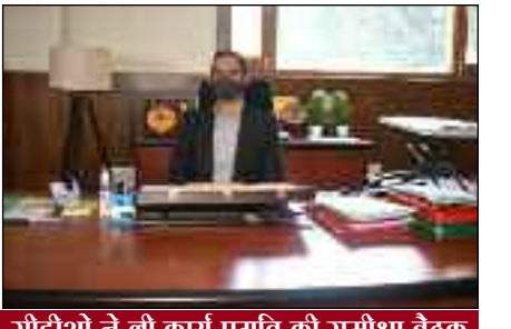
सीडीओ ने ली कार्य प्रगति की समीक्षा बैठक खबर पृष्ठ 8 पर देखें

वर्ष: 5 अंक: 301 कोटद्वार बुधवार 21 अक्टूबर 2020 मूल्य: 3 रुपये पृष्ठ: 8 Email: loksanhita@gmail.com 9758416901, 8958551111, 9045739612