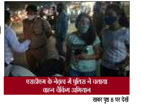
खबर पृष्ठ 8 पर देखें

दैनिक लोक संहिता सुधी पाठकों को सूचित किया जाता है कि लोक संहिता की अपनी प्रति प्राप्त करने के लिए आप अपने क्षेत्र के अखबार वितरक से सम्पर्क करें। लोक संहिता अखबार बाजार में भी रमेश एजेंसी एवं अर्जुन बुक डिपो निकट रोडवेज बस अड्डे से भी प्राप्त किया जा सकता है।